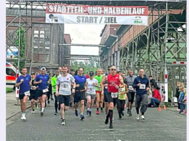
Start- und Zielpunkt ist jeweils auf der Zeche Westfalen.

Die Anmeldungen sind jederzeit möglich, auch Spätsentschlossene sind nach Aussagen der Veranstalter herzlich eingeladen, die Laufschuhe zu schnüren, mitzumachen und dem Bergruf der Halde zu folgen. (pm)