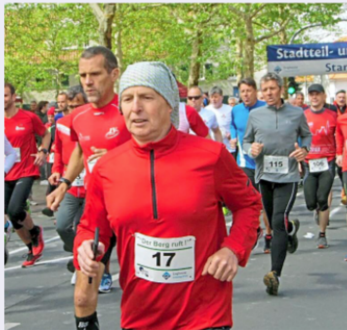
Das Teilnehmerfeld ist in jedem Jahr bunt gemischt. Anmeldungen sind ab sofort möglich, aber auch Kurzsentschlossene können mitmachen.

Ursprünglich wurde der Lauf quer durch die Bergarbeiterkolonie angeboten, doch im letzten Jahr hat sich der Start- und Zielpunkt auf der Zeche Westfalen bewährt, auch aus dem Grunde, da der Aufwand mit Straßensperren aktuell bei Weitem geringer sei, wie Huerkamp feststellt.