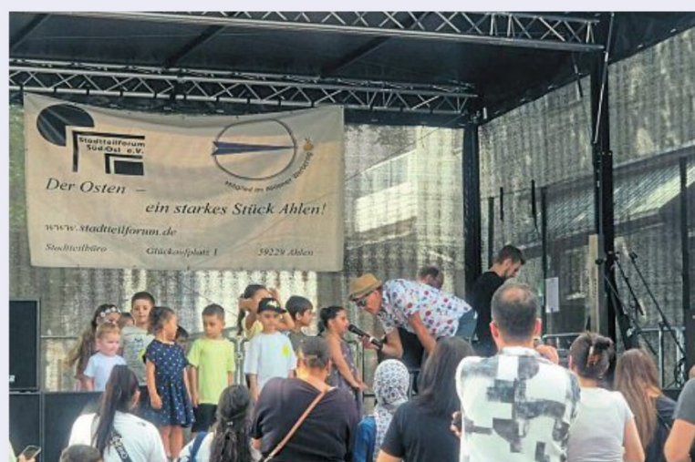
Schon die Kleinsten machen mit.