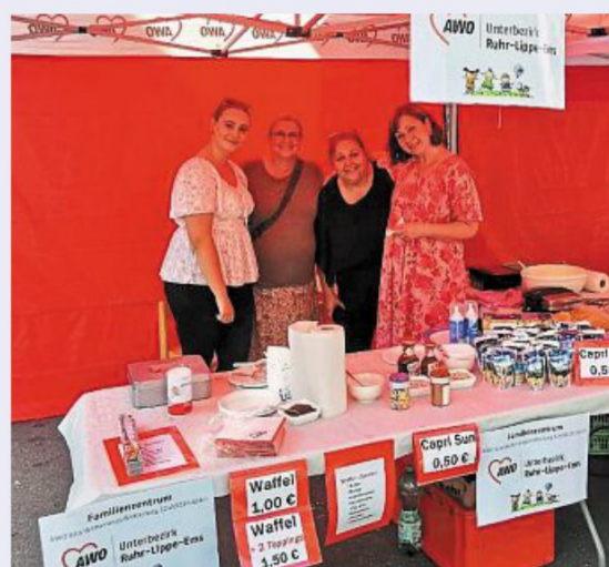
Der rote Aktionsstand der Arbeiterwohlfahrt.