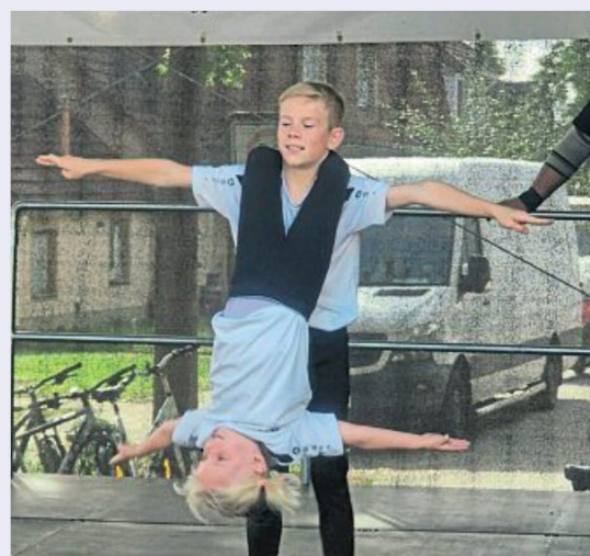
Akrobatik bei der Tanzsportgruppe von Vorwärts Ahlen.