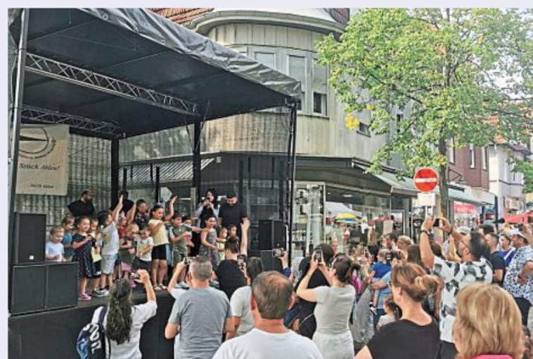
Der Kindergarten Im Brunnenfeld bei seiner Aufführung. Die Eltern filmen fleißig mit.