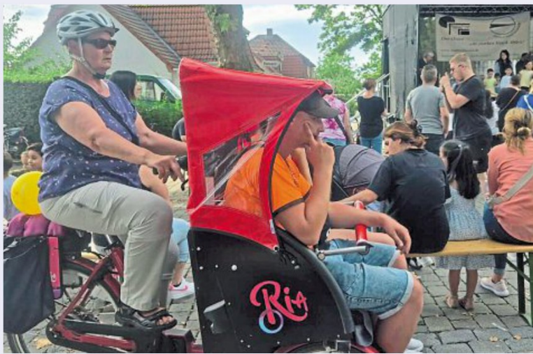
Mit der Rikscha ging es über das Stadtteilfest.