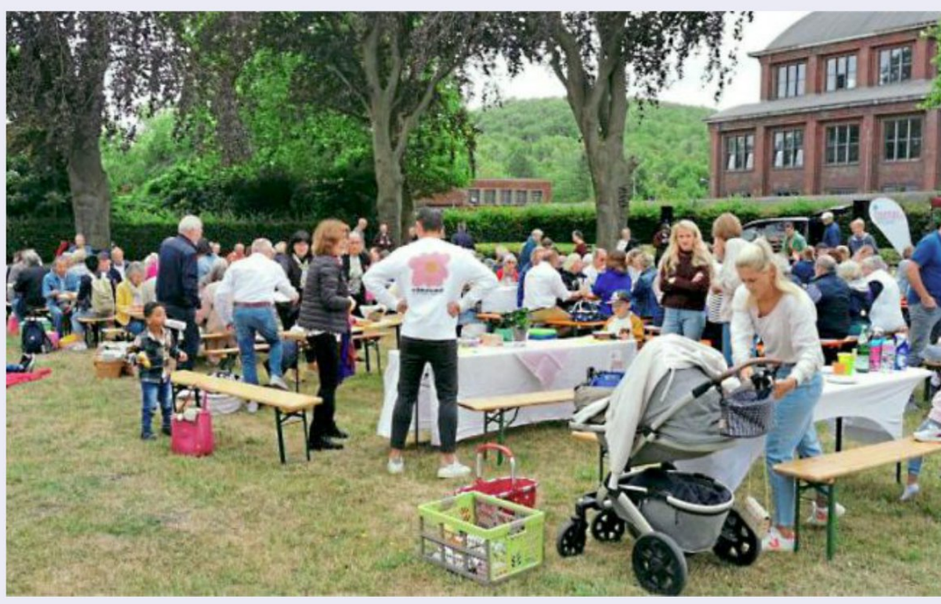
Der Bürgerbrunch auf dem Morsbach-Platz findet am 21. Juli von 11 bis 15 Uhr statt.