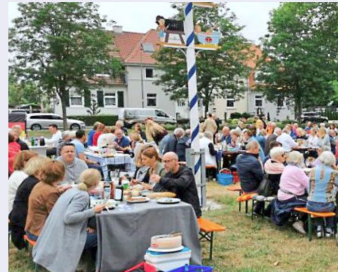
Die Tische sind in jedem Jahr reich gedeckt.