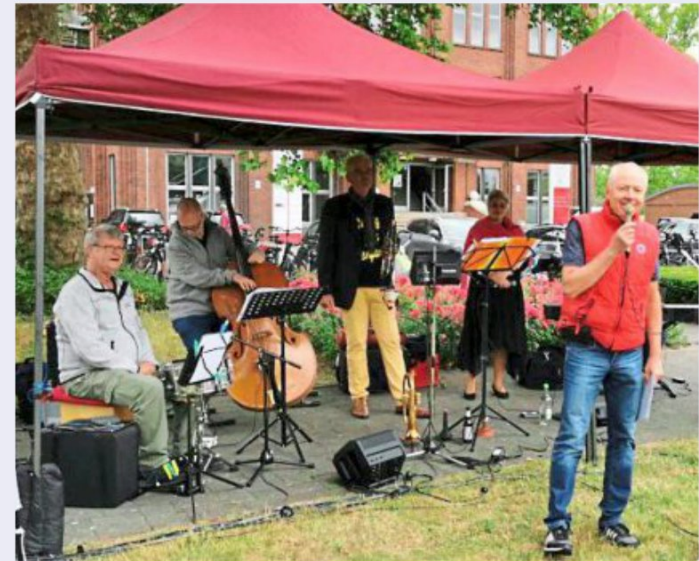
Passende Musik darf nicht fehlen.