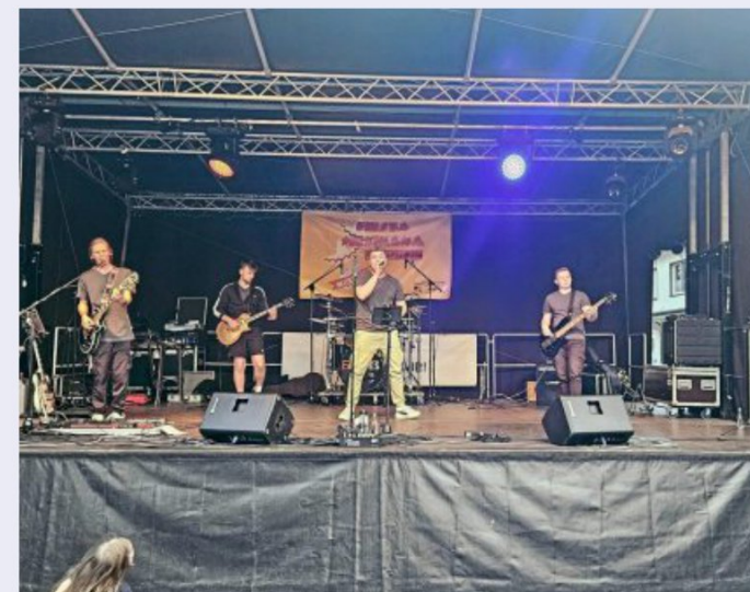
Die Band aus dem Ahlener Süden "Six Pages" brachten spätestens mit den Coverstücken von den Toten Hosen das Publikum in Wallung.