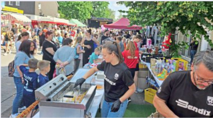
Kulinarischer Tipp: Selbstgedrehte Kartoffelspiralen vom Förderverein RW Ahlen Damenfußball-

kordzahl von Akteuren vor und hinter den Kulissen die passende Bühne zu bieten. 80 Aktive, 20 Aktions- und 40 Flohmarktstände – so die beeindruckenden Zahlen. Das Bühnenprogramm zeigte sich bunt und voller Power. Musik wechselte sich mit Tanzeinlagen ab, an denen eine Vielzahl Ahlener Vereine und Institutionen beteiligt waren. Abseits der Bühne wurde von Puppentheater bis Bungee-Jumper für jeden Geschmack etwas geboten. Mit Livemusik am Abend mit „Shanneningans“ und „Six Pages“ klang das Fest aus.