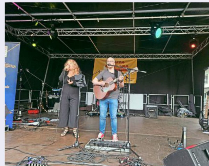
Das Akustikduo "Shannennigans", ein Geheimtipp aus Ostwestfalen, war ab 19 Uhr auf der Bühne mit einfühlsamen Liedern zum Übergang des Abendprogramms.