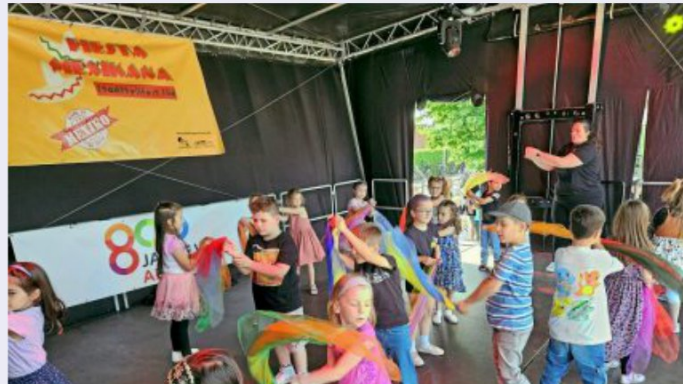
Die Kita Milchzahn überraschte mit einem bunten Tüchertanz und sorgte für Rythmus.