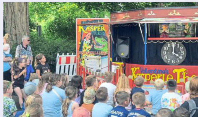
Die Puppenbühne Valentino aus dem Ahlener Osten war bei der 8. Fiesta Mexicana traditionsgemäß dabei und der Kasper begeisterte die Kinder.