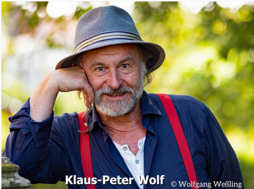
Klaus-Peter Wolf

Mord und Meer in der Ahlener Zeche Westfalen am 24. September, ab 19.30 Uhr: Wenn Klaus-Peter Wolf im Norden morden lässt, erleben Leser*innen regelmäßig spannende Kriminalfälle. Denn Deutschlands derzeit auflagenstärkster Krimistar und Bestsellerautor sorgt mit seinen Ostfriesenkrimis für Unterhaltung der Extraklasse. An diesem Abend hat er gleich zwei hochspannende Krimis im Gepäck. In "Ostfriesensturm", dem 16. Fall für Ostfrieslands Top-Ermittlerin und Kult-Kommissarin Ann Kathrin Klaasen, wird in einer Ferienwohnung auf Wangerooge die Leiche eines Mannes gefunden. Die Tötungsart lässt vermuten, dass hierfür das organisierte Verbrechen verantwortlich ist - ein Verdacht, der Ann Kathrin und ihr Team sofort in höchste Alarmbereitschaft versetzt. In "Rupert undercover - Ostfriesisches Finale" steht der dritte